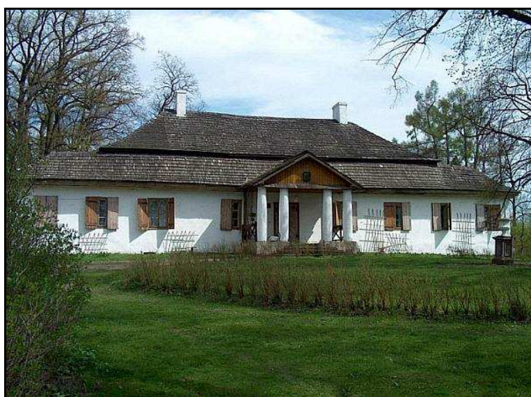
Fot.6. Dwór w Ludynii, widok z przodu. (w w w .krasocin.com.pl).