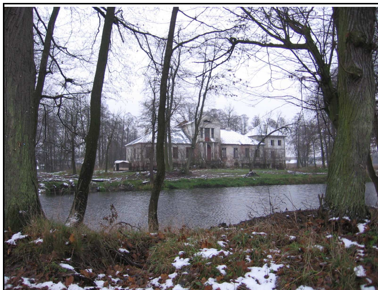
Fot.3. Dwór w Olesznie, fot. Katarzyna Ciupa.

Terytorium Gminy odznacza się dużym nagromadzeniem obiektów zabytkowych o różnym charakterze: sakralnym, użytkowym i krajobrazowo-przyrodniczym wpisanych do rejestru zabytków.