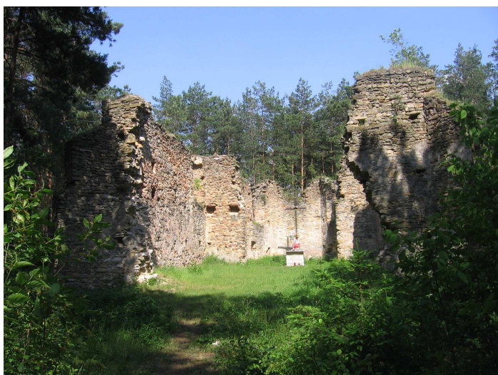
Fot.8. Ruiny zboru w Gruszczynie, fot. Katarzyna Ciupa.