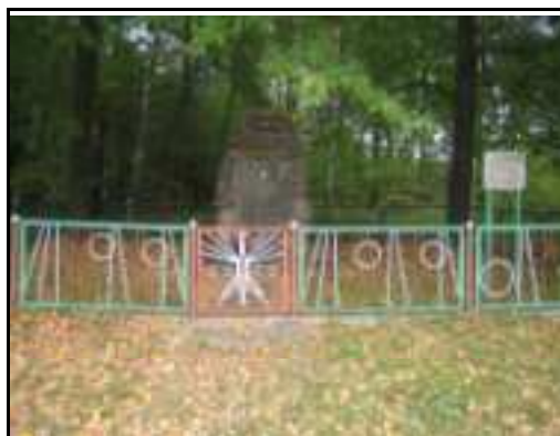
Fot.9. Chotów : pomnik partyzanckiej bitwy, 1944 r. (w w w .krasocin.com).