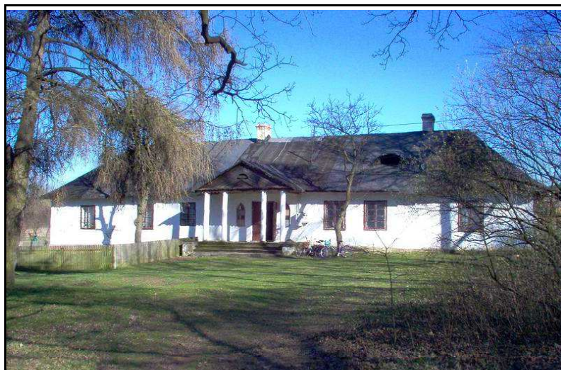
Fot.5. Dwór w Woli Świdzińskiej.