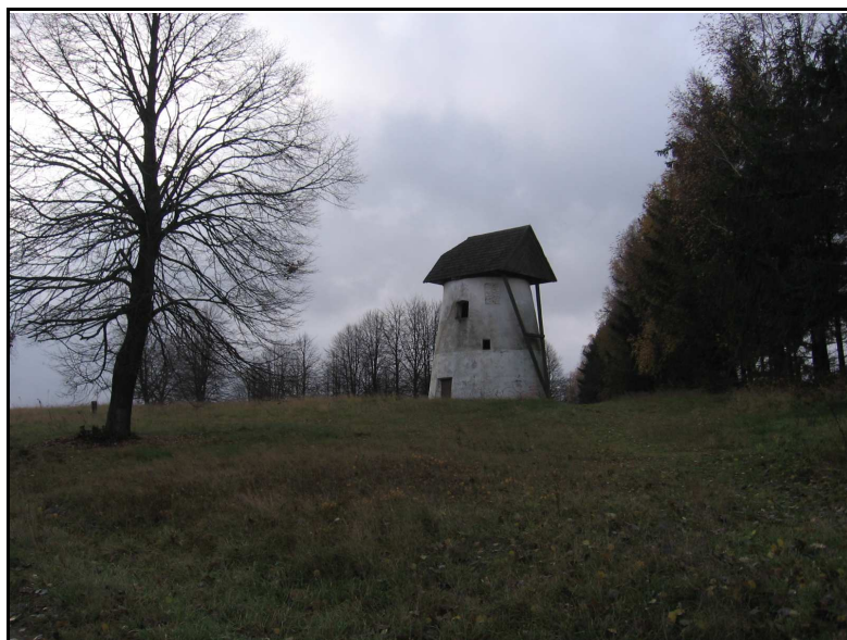
Fot.4. Wiatrak Holenderski w Krasocinie