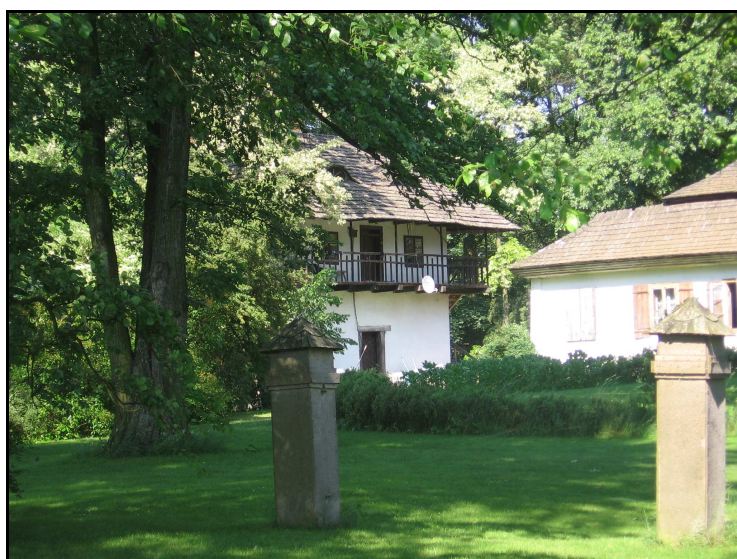
Fot.7. Dwór w Ludynii, fot. Katarzyna Ciupa.