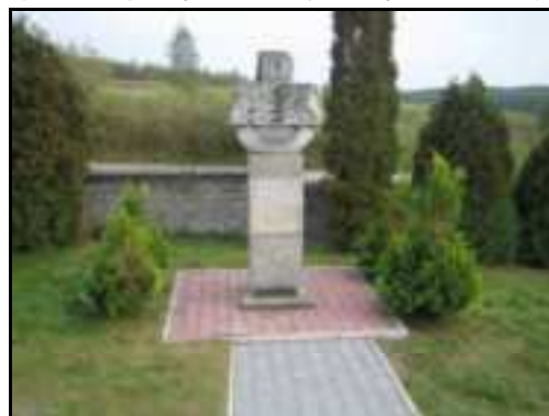
Fot.10. Pomnik Pamięci Żołnierzy AK Poległych za Ojczyznę w Olesznie.