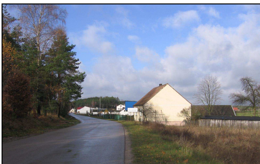
Fot.2. Wieś Gruszczyń, fot. G. Ferliński.

Obszar gminy Krasocin położony jest w dorzeczu Pilicy oraz częściowo w dorzeczu Białej Nidy (południowo-wschodni fragment gminy). Największym ciekim płynącym przez Gminę jest Czarna - prawobrzeżny dopływ Pilicy, wzdłuż której przebiega fragment północno-zachodniej granicy gminy. Ponadto, przez terytorium gminy przepływa kilka mniejszych, bezimiennych cieków.