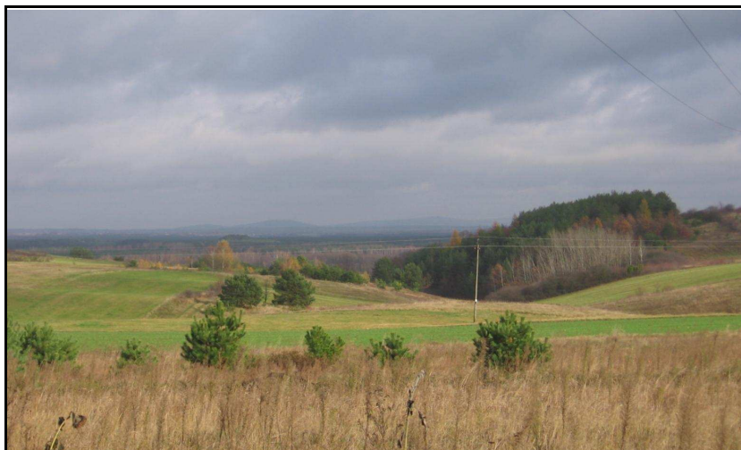
Fot.1. Okolice wsi Występy, fot. G. Ferliński.

Gmina Krasocin położona jest na pograniczu dwóch jednostek fizyczno-geograficznych: Niecki Nidziańskiej i Wyżyny Kielecko-Sandomierskiej. Przez środkową część przebiega z północnego-zachodu na południowy-wschód ciąg wyniesień zwany Pasmem Przedborsko-Małoskim, stanowiący najdalej na zachód wysunięty fragment Gór Świętokrzyskich. Obszary położone po obu stronach pasma mają charakter nizinnej równiny.